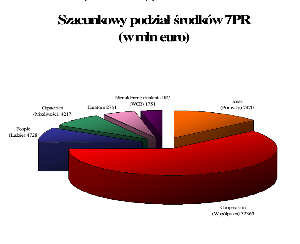
Rys. 3. Szacunkowy podział środków 7. PR (w mln euro).

Źródło: 7 Program Ramowy – jutrzejšie odpowiedzi mają swój początek dziś , Komisja Europejska, Wspólnoty Europejskie 2006.