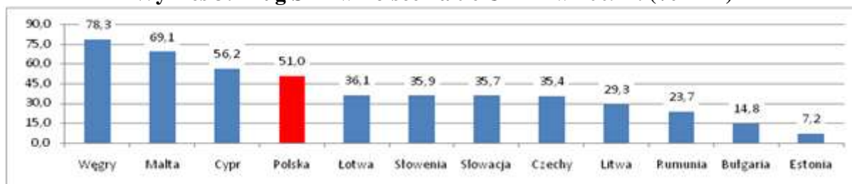
Wykres 3: Dług SFP w Polsce na tle UE-12 w 2009 r. (%PKB)